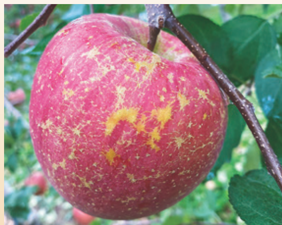
夏季の高温により発生が助長

②ふじの果点アレ、サビが軽減され、油上がりもなく等級が良くなった。夏季は毎年使いたい。