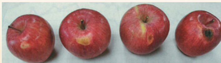
夏季の高温・乾燥による日ヤケ、クリスタル症